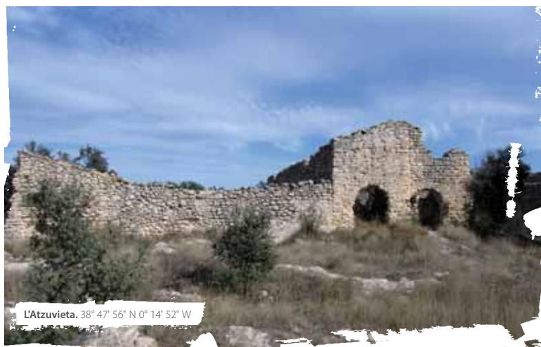
L'Atzuvieta. 38° 47' 56" N 0° 14' 52" W

conforman un entorno urbano agradable. Rápidamente lo cruzaremos y al salir de él, junto a una fuente, continuaremos en ascenso por camino de tierra. El tramo se endurece a partir de los dos kilómetros y medio desde las últimas casas. Nos adentramos en la sierra. Van quedando atrás los cultivos y, a medida que ganamos altura, vemos a nuestra izquierda el castillo de Margarida. Este castillo es quizás el de más difícil acceso de todo el territorio valenciano, hasta el extremo que para alcanzarlo es necesario utilizar técnicas de escalada. Es posible que en su origen se entrase por una rampa o escalera adosada a la pared de la cual quedan restos de basamento. Por la parte orientada a Margarida, de la que le separa el profundo cauce del Barranc de l'Encantada, la fortaleza se desploma en un impresionante