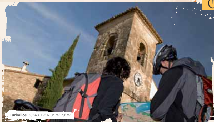
Turballos. 38° 48' 19" N 0° 26' 29" W

rutómetro. En el Port d'Albaida, nos incorporamos al arcén de la carretera nacional durante apenas trescientos metros, pero debemos extremar las precauciones ya que es una vía con alta densidad de tráfico. Tras cruzar un viejo puente, ya fuera de la carretera, seguiremos el Cami dels Fontanars hasta el corral de Diego por el que seguiremos recto. Habremos superado un desnivel de unos cien metros desde el viejo puente, al inicio de la senda, y de trescientos metros desde Turballos. Las vistas aquí son impresionantes. La sierra Mariola por un lado y la Vall d'Albaida por otro. Al llegar a la pista forestal que viene de Atzaneta habremos rebasado el punto más alto de nuestra ruta de hoy. Una cruz de hierro nos indica que vamos por buen camino y a partir de aquí, el paisaje cambia totalmente. Estamos en la umbría del Benicadell, una de