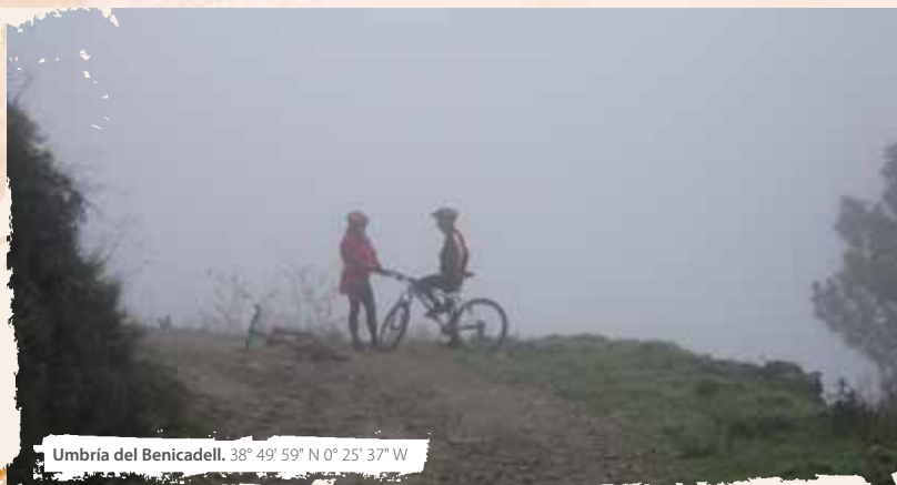
Umbria del Benicadell. 38° 49' 59" N 0° 25' 37" W

una carretera de poco tráfico, pero el ciclista en el asfalto es muy vulnerable. Por eso cualquier precaución es poca y siempre debemos moderar la velocidad. Desde Beniarrés, la vuelta a L'Orxa ya la conocemos. También podemos comenzar y finalizar este sugerente itinerario desde el punto de información instalado en Beniarrés.