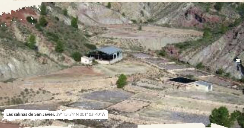
Las salinas de San Javier. 39° 15' 24" N 001° 03' 40" W

medida que ganamos altura. La erosión sobre estas agujas de piedra les ha dado formas extrañas y originado canchales creando un paisaje mágico y peculiar. La disolución de la roca caliza por el agua de lluvia hace que tengan estas formas caprichosas, arbitrarias, advenedizas y en cierto modo, vivas. En el kilómetro cinco de nuestra ruta, pasamos junto a las salinas de San Javier, al fondo del barranco del Tollo. Las salinas fueron explotadas hasta bien entrada la década de los noventa, y de ellas se extraía sal que era utilizada con finalidad alimentaria, industrial y para evitar que se formase hielo en las carreteras. El conjunto está formado por una serie de depósitos escalonados de piedra y separados por madera para aumentar la efectividad de la evaporación y el secado, contando con varias balsas para el almacenaje del agua y un pozo para la extracción de la misma. Todo ésto es lo que al menos se ve desde