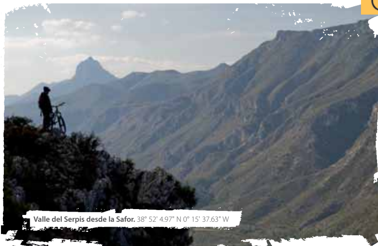
Valle del Serpis desde la Safor. 38° 52' 4.97" N 0° 15' 37.63" W

Es como una lección de geología, ya que veremos la falla abierta entre la sierra de Ador y la Safor, sobre la que nos encontramos y, como el Serpis, se ha abierto paso hacia el mar. Los alzamientos posteriores en épocas geológicas más recientes, han provocado que el desnivel hasta el lecho fluvial sea mayor que la propia erosión. En cuanto nuestro camino comience a descender ligeramente, unos dos kilómetros y medio después de haber rebasado el collado tras el último chalet, veremos un desvío a la izquierda. Aunque en el rutómetro no aparezca marcado, este desvío nos lleva a la Font dels Olbits, un agradable rincón ideal para comer algo y descansar. También disponemos de agua de la fuente por si la necesitamos y desde este punto comienza una de las excursiones a