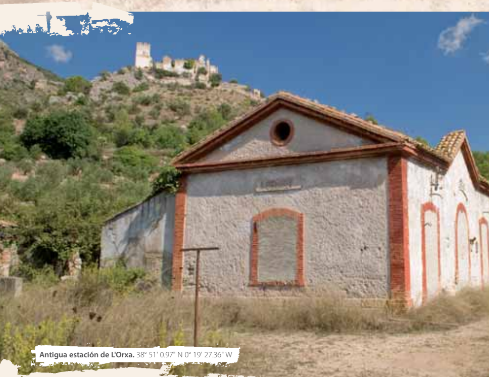
Antigua estación de L'Orxa. 38° 51' 0.97" N 0° 19' 27.36" W

de los tamarindos y caducifolios delatan la presencia del embalse que en esta época del año está en su mejor momento, tanto por la abundancia de agua, como por el cromatismo inconfundible del marco que lo envuelve. Junto a él, y como una profunda cicatriz entre montañas, el Barranc de l'Encantada le entrega sus aguas y forma un paraje natural que tiene la consideración especial de micro-reserva de flora en el alto de Senabre.