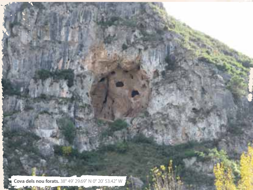
Cova dels nou forats. 38° 49' 29.69" N 0° 20' 53.42" W

En Beniarrés, podemos encontrar todo tipo de servicios para descansar y recuperar fuerzas, tanto si deseamos volver por el mismo sitio, como si queremos prolongar nuestra estancia con cualquiera de las rutas de nuestra guía.