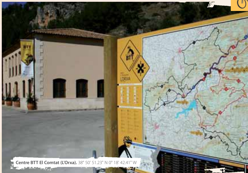
Centre BTT El Comtat (L'Orxa). 38° 50' 51.23" N 0° 18' 42.41" W

la erosión ha sido cada vez más intensa tras el abandono. La naturaleza vuelve a suavizar las formas y a modelar el perfil que un día le fue arrebatado. Los campos de olivos y almendros más cercanos al camino y de mayor facilidad de acceso están mejor cuidados. La comunicación rápida y sin problemas con el pueblo ha permitido que se sigan cultivando, aunque en muchas ocasiones, el trabajo de la tierra apenas de para cubrir gastos. Las terrazas, más elevadas en los lugares más abruptos, han sido abandonadas definitivamente. Entre ellas, si nos fijamos, veremos también antiguas masías y corrales todavía en pie ubicados en lugares que desconciertan por su altitud.