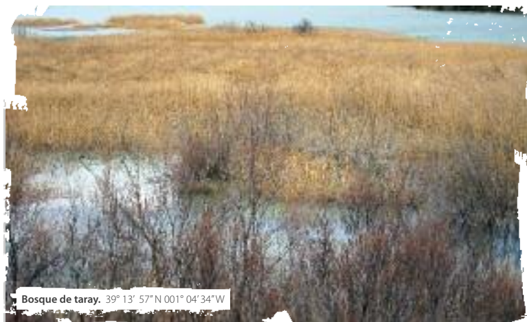
Bosque de taray. 39° 13' 57" N 001° 04' 34" W

en el pueblo de Gata de Gorgos. El barro permanente y la presencia de cañas, carrizos y eneas confunden y enmarañan este espacio que es dominio tan sólo del río. A veces, algún sendero marcado y mantenido por los pescadores, permite acercarse a la orilla, pero no es muy recomendable por la inestabilidad del firme acuoso y fangoso, donde tan sólo la vegetación sujeta el terreno y lo defiende de las grandes avenidas. El papel de las raíces y las ramas caídas, es fundamental en la sujeción de los márgenes y en mantener los lindes evitando la erosión de las aguas. También es el refugio de muchas especies de aves y mamíferos que encuentran aquí, la protección necesaria para anidar o reproducirse. A veces, las anátidas fabrican sus nidos a pocos centímetros del suelo amparándose en la espesura.