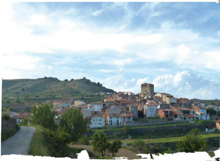
figura del "Pi Marianet", un enorme pino que contrasta con las esbeltas figuras de los aerogeneradores. Volviéndonos hacia el camino que debemos tomar, a la derecha según progresábamos, tenemos al fondo el pueblo de Castellfort, y sobre él, entre los aerogeneradores, se recorta contra el cielo el robusto bloque de la ermita de "Sant Pere", destino de importantes romerías desde diferentes poblaciones de la comarca, entre ellas el propio Portell. La pista, siempre entre paredes,

acaba en una carretera secundaria asfaltada, justo en el momento en que esta nace de la carretera principal que une Portell y Cincorres. Debemos atravesar esta segunda, la principal, y volver hacia Portell en sentido inverso al que llevábamos, por una pista que sale en el lado opuesto de la carretera, y que, sin dejarla, nos llevará de nuevo a la entrada de Portell. Justo finaliza cruzando la carretera que va a Villafranca del Cid, e introduciéndose en el casco urbano de Portell por la calle principal.